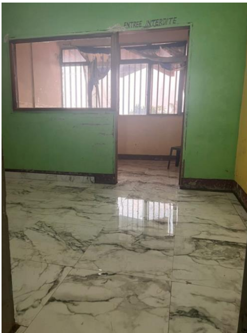
Salle de néonatalogie après travaux