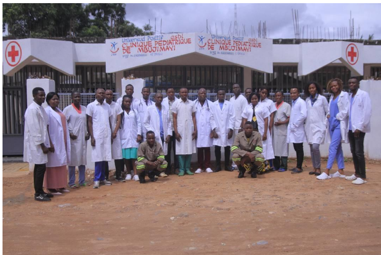
Clinique Pédiatrique de Mbuji-Mayi (RDC), premier partenaire de Munda ASBL.

Améliorons le bien-être d'enfants du Sud