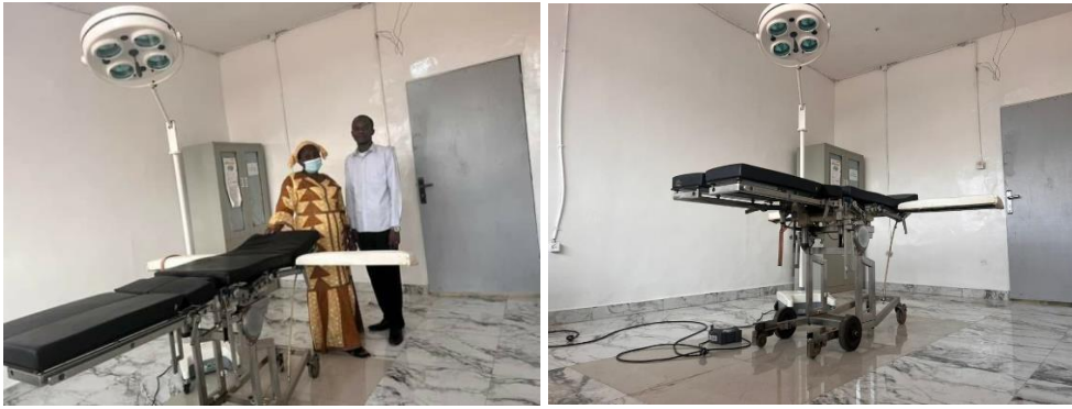
Salle d'opération après travaux