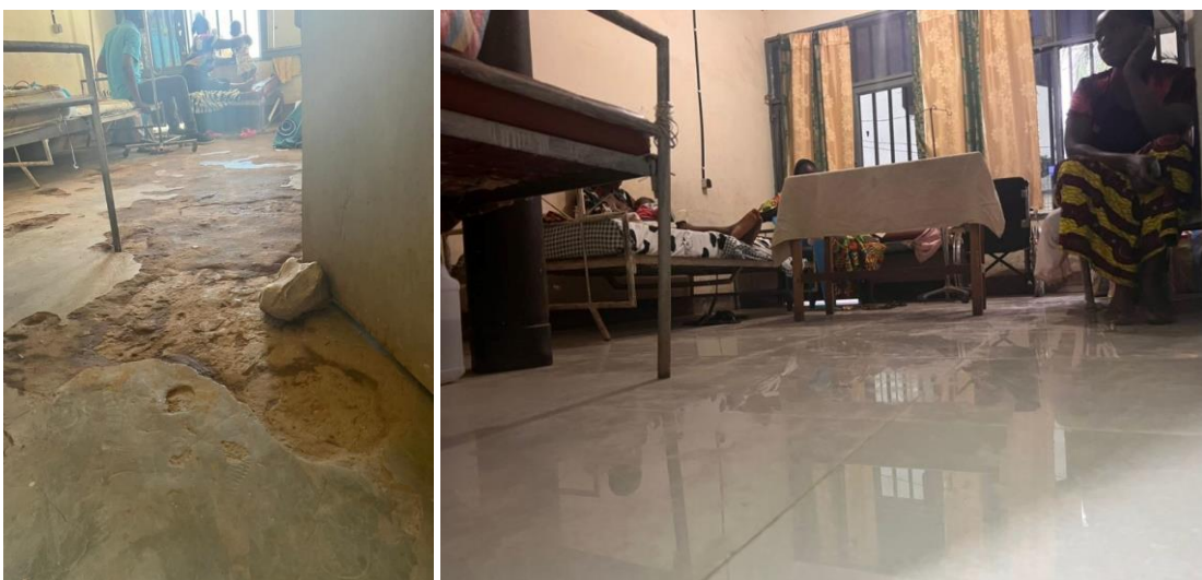
Salle d'hospitalisation des enfants drépanocytaires avant et après travaux